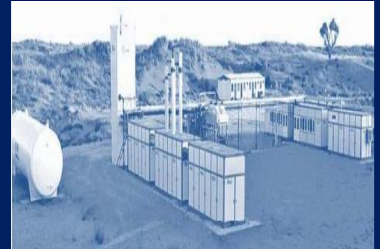
PT Indo LNG Prima

Anak Perusahaan di sektor hilir minyak dan gas bumi akan tetap mampu secara konsisten untuk terus memberikan kontribusi pendapatan bagi Perseroan