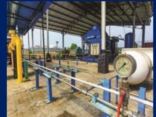
Mother Station Kalidawir