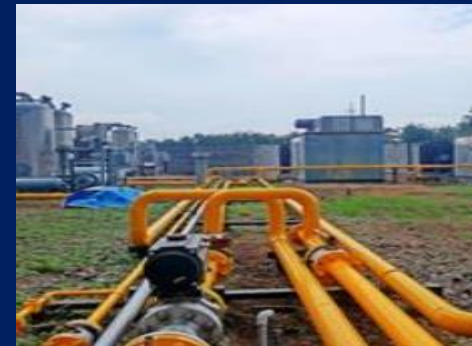
Mother Station Wunut