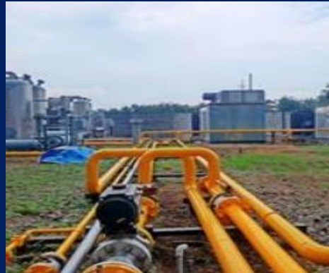
Mother Station Wunut