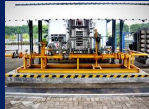
Gas Metering Sidoarjo