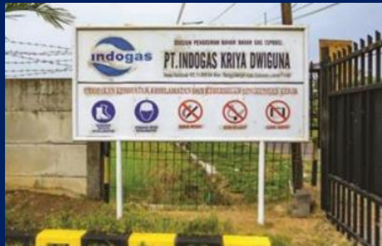
Mother Station Kalidawir