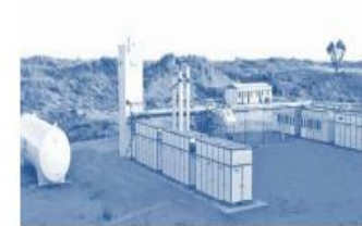
Nano LNG Facility