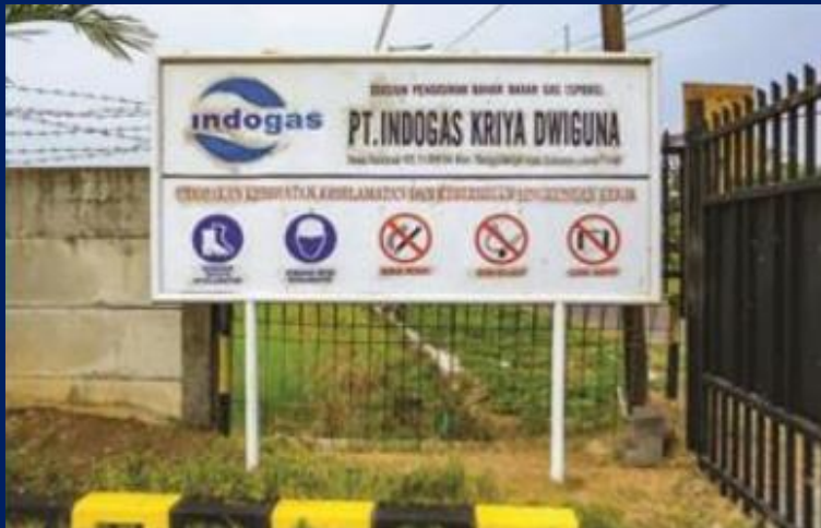
PT Indogas Kriya Dwiguna