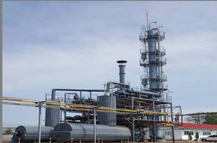
PT Indo Kilang Prima