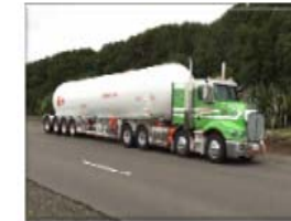
LNG Tranpostation Vehicle