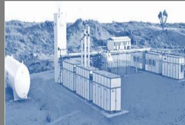
PT Indo LNG Prima

Anak Perusahaan di sektor hilir minyak dan gas bumi akan tetap mampu secara konsisten untuk terus memberikan kontribusi pendapatan bagi Perseroan