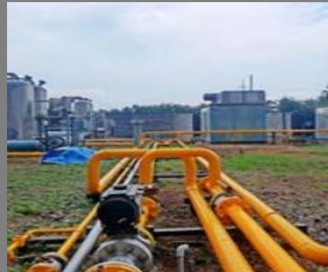
Mother Station Wunut