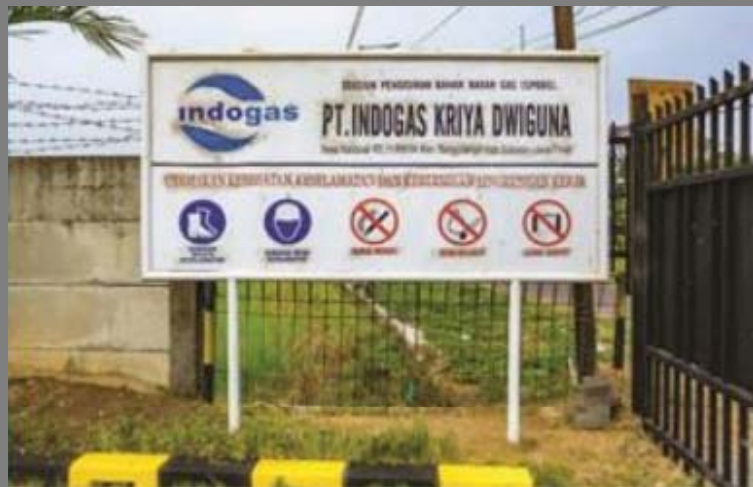
PT Indogas Kriya Dwiguna