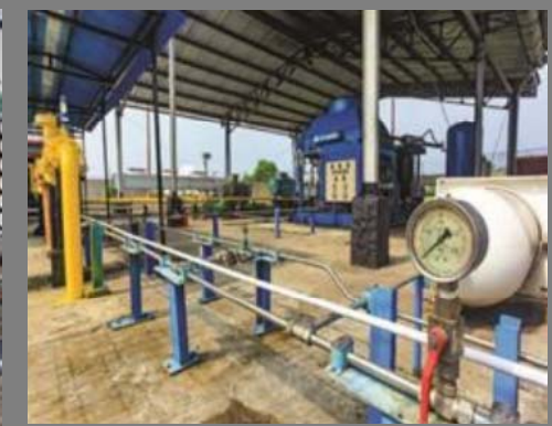
Mother Station Kalidawir