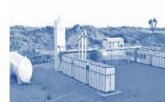
Nano LNG Facility