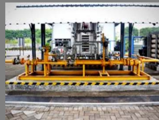
Gas Metering Sidoarjo