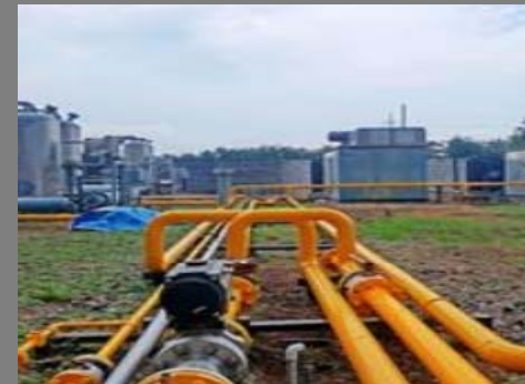
Mother Station Wunut