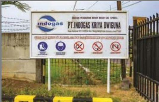
Mother Station Kalidawir